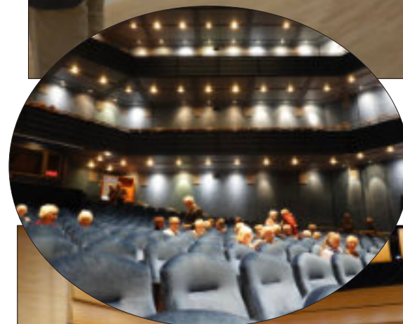
Stor och blå är konsertsalen i Norrköping.