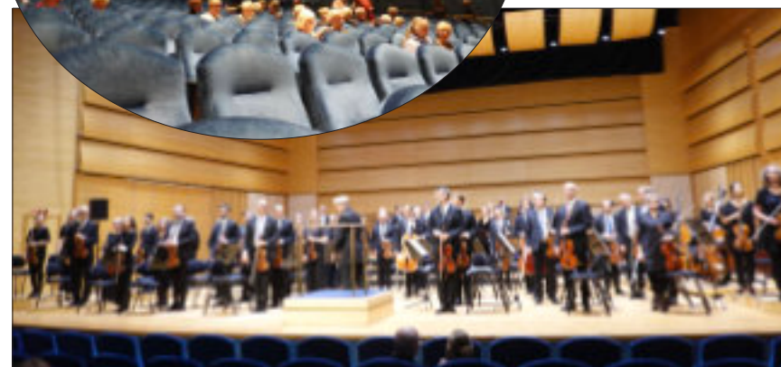
Över 80 musiker sitter i Norrköpings symfoniorkester, en sal som utformats av Bo Karlberg som också var arkitekt för Gävle Konserthus.