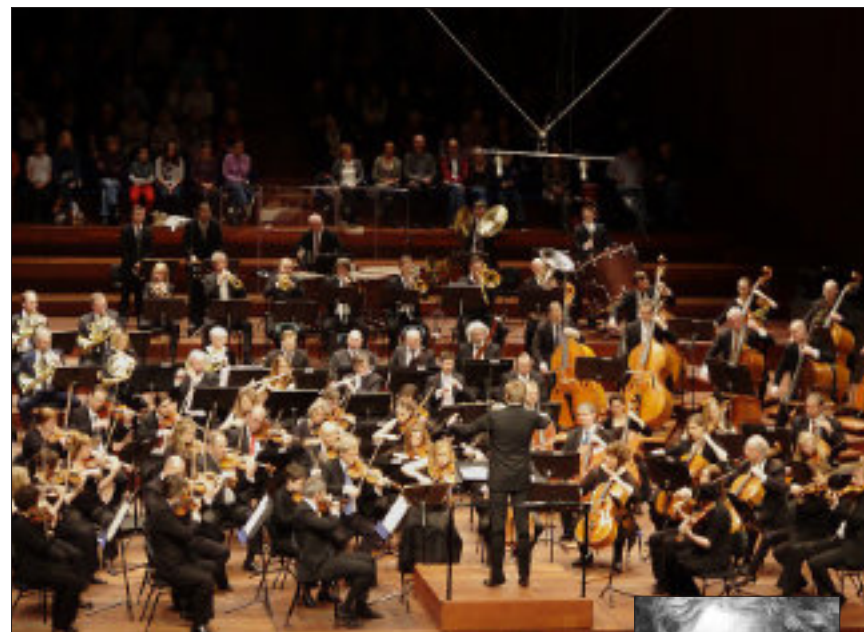
Oslo filharmonien.

07.15 Avresa med buss från Konserthuset Gävle Lunch Värmlands Museum, Karlstad Entré och visning Lars Lerins Museum Kvällsbuffé på hotellet i Oslo, centralt beläget