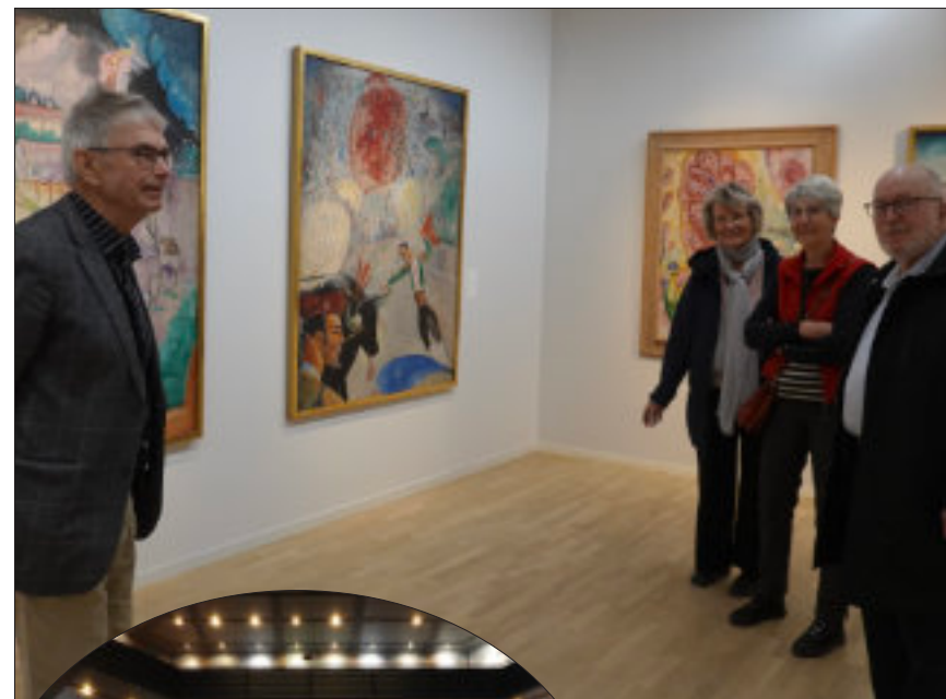
Vår grupp gick runt och njöt av konsten i Norrköpings konsthall.